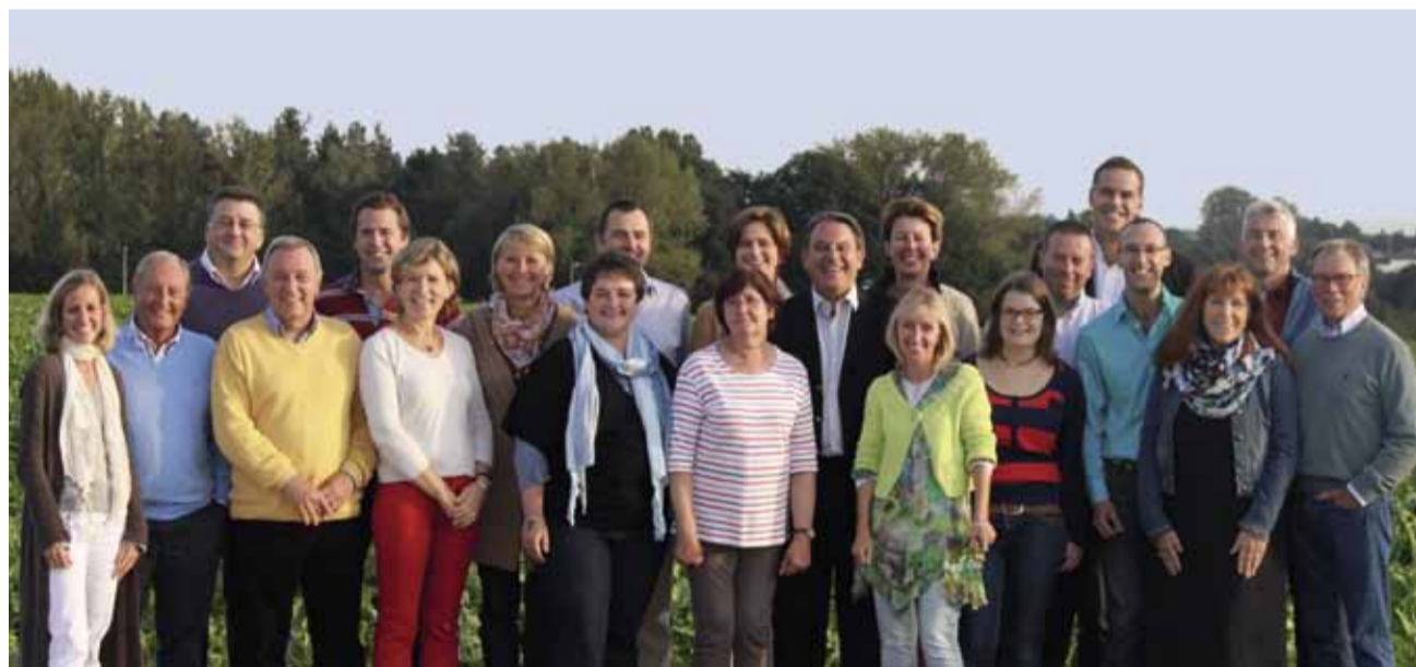
Une équipe pour défendre avec cœur un mieux-vivre ensemble à Chaumont-Gistoux.